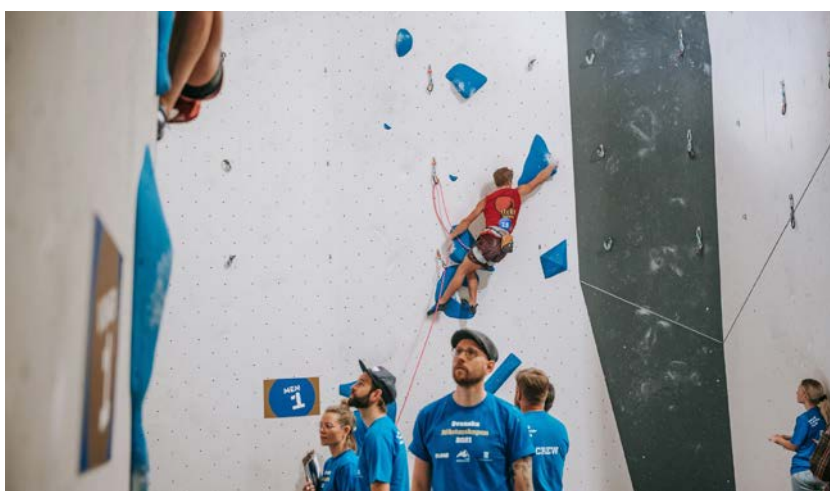
Det var lätt att hitta funktionärerna. Klubben och Klätterhuset skapade ett proffsigt arrangemang med hjälp av enhetliga färger och design.