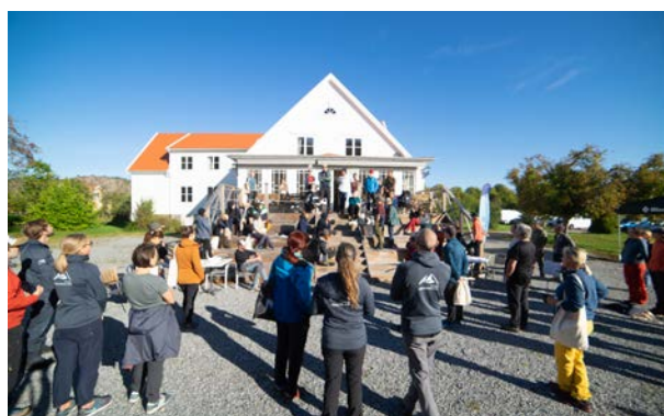
Klätterträffen utgick från Villa Bro i Brodalen, ett populärt boende för klättrare som besöker Bohuslän.

#viklättrar Bohuslän var en välkommen paus inför vinterns pandemi. Vi på SKF vill tacka alla som deltog. Ni vet vilka ni är.