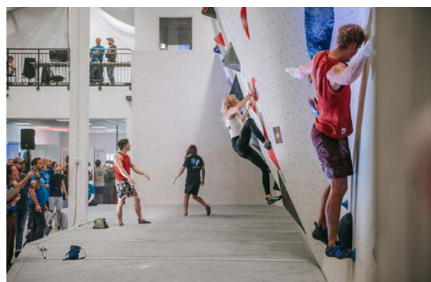
Restriktionerna släppte delvis strax före SM, vilket möjliggjorde för arrangörerna att släppa in publik. Ett välkommet avbrott under pandemin, som annars präglade året.